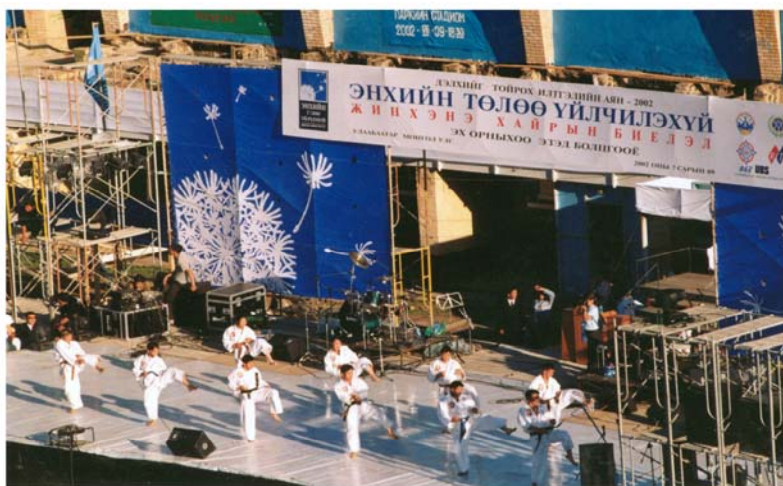
Выступление на ралли «Служба миру» в Монголии 2002 г.

*Предшественником всех этих представлений является Сунг-Хва Е Бон, первая попытка исполнить технику Тонг-Иль Мо-До под музыкальное сопровождение.